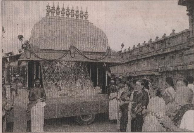
தஞ்சை பெரிய கோயில் முன் அறுபத்தி மூவர் நாயன்மார்களின் சிலைக்கு மாலை அணிவித்து வழிபடும் பொதுமக்கள்.

தஞ்சாவூர் பெரியகோயில் முன் அறுபத்தி மூவர் நாயன்மார்களின் சிலைகளுக்கு மாலை அணிவித்து அபிசேகம் செய்து வழிபட்டனர்.